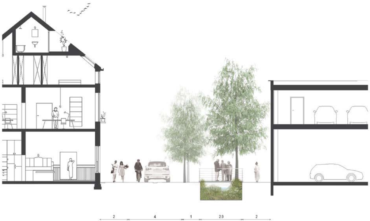
Trawoolstraat als tuinstraat. Openleggen van de Trawool is hier niet mogelijk wel het verbeelden van het tracé door waterbufferbekken.