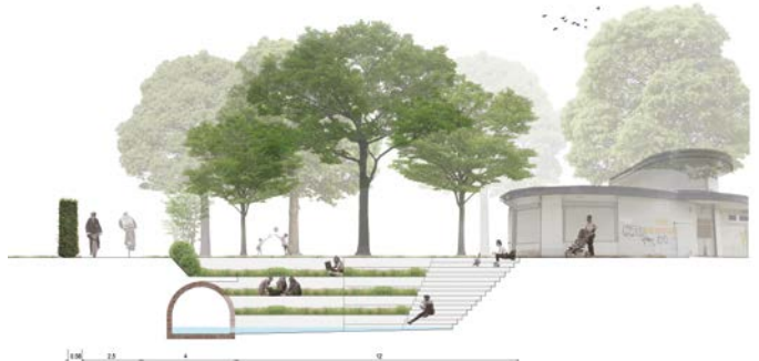
Ontwerpend onderzoek deelgebieden boven en linksonder: vergroenen van overgedimensioneerde Leuvensesteenweg; rechtsonder: 'Trawool-theater' in stadspark met zicht op opengewerkt gemetst gewelf.